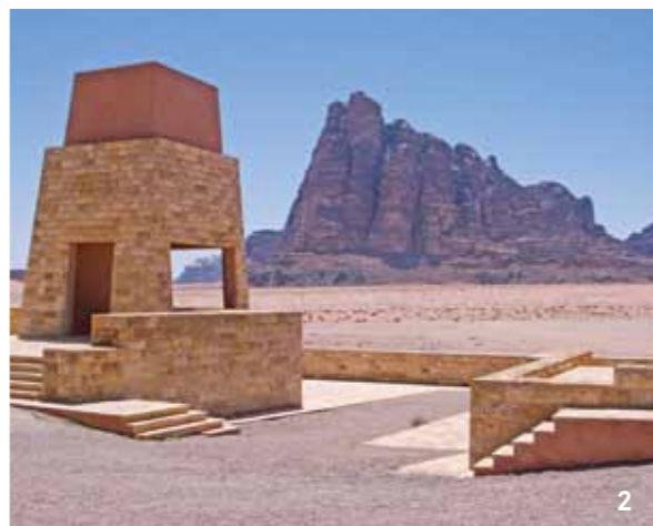
ZAUBERHAFTE MÄRCHENWELT Die korinthischen Säulen von Jerash, Gerasa, einer der bedeutenden zehn antiken Handelsstädte im Vorderen Orient (1); die sieben Säulen der Weisheit im Wadi Rum (2); Vielfalt auf dem Suq in Amman (3); Beduinenromantik (4)